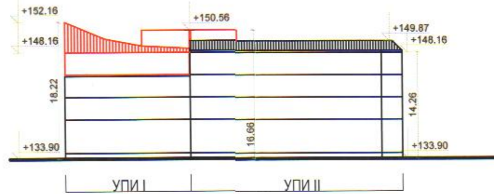
Силует по ул. Георги Дражев

Работен Устройствен План за УПИ I и УПИ II, квартал 59, център, гр. Ямбол М 1:500