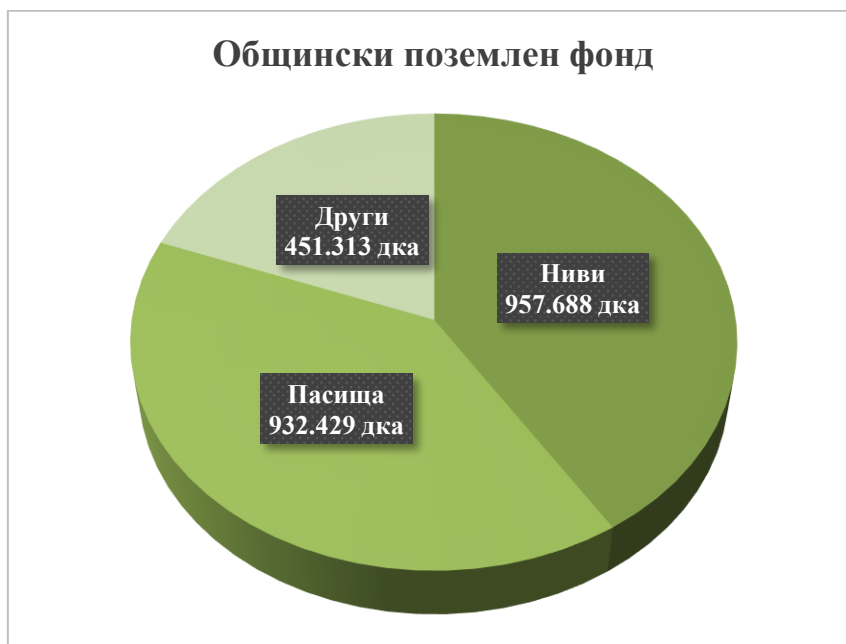
Фигура № 4 Разпределение на общинския поземлен фонд