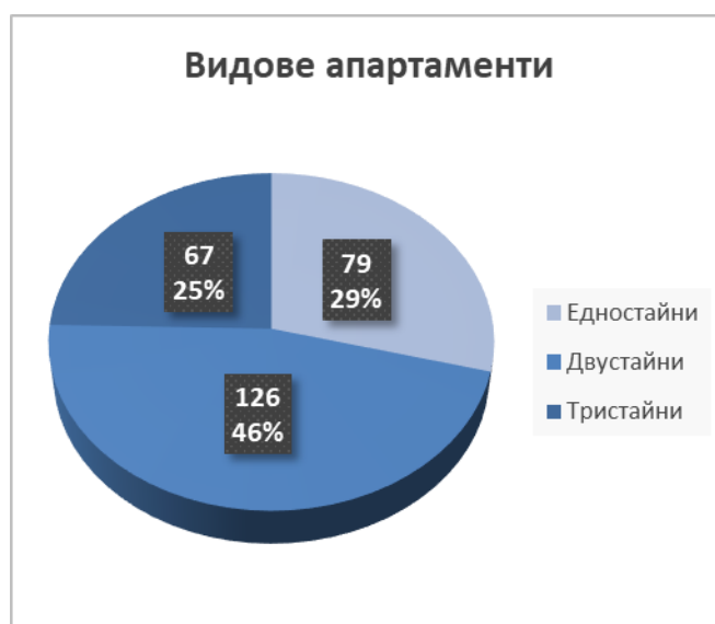
Фигура № 2 Разпределение на жилищните имоти - апартаменти