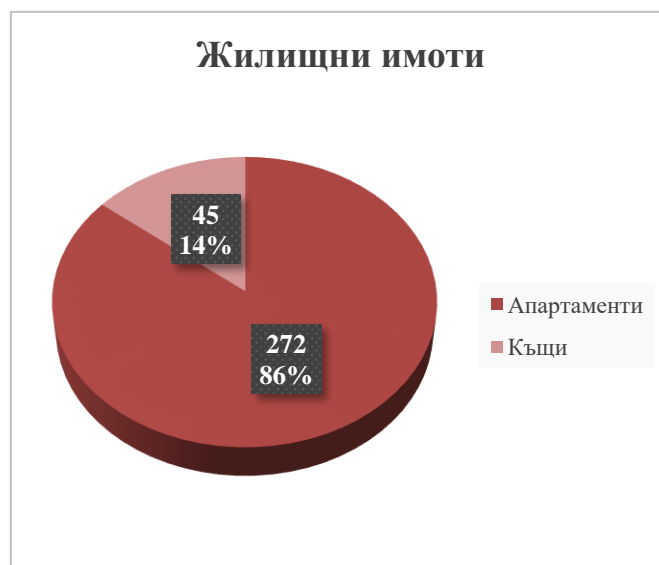
Фигура № 1 Разпределение на жилищните имоти