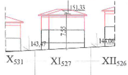
СИЛУЕТ ОТ УЛ "ПЛАЧКОВИЦА"