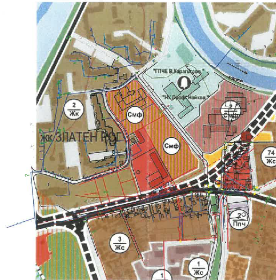
ПРОЕКТ ЗА ИЗМЕНЕНИЕ НА ОБЩ УСТРОЙСТВЕН ПЛАН на гр. ЯМБОЛ за имоти с ИДЕНТИФИКАТОРИ 87374.560.49, 87374.560.62 и 87374.560.63 - М 1:5000