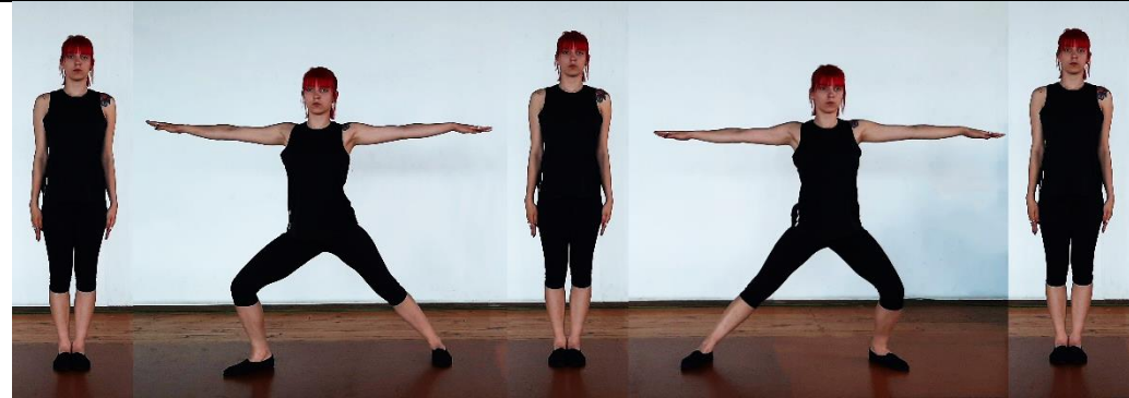
И.П. в дясно 1-2т. 3-4т. в ляво 5-6т. 7-8т.