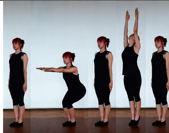
И.П. 1-2т. 3-4т. 5-6т. 7-8т.