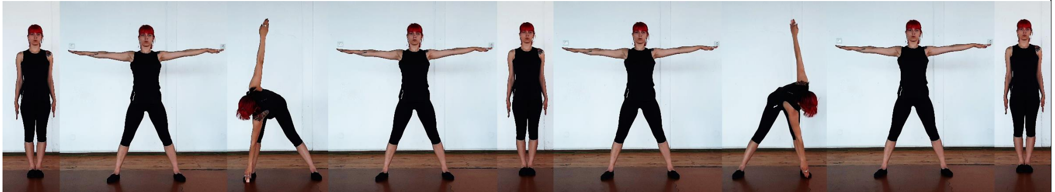
И.П. в дясно 1т. 2т. 3т. 4т. в ляво 5т. 6т. 7т. 8т.