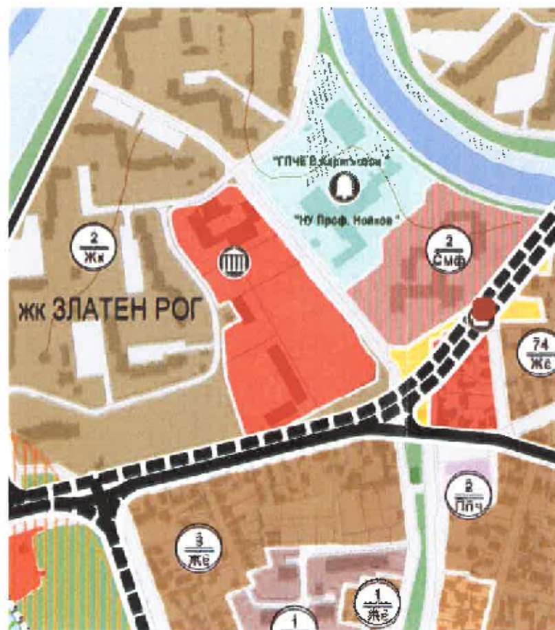
ИЗВАДКА ОТ ДЕЙСТВАЩА ОБЩ УСТРОЙСТВЕН ПЛАН на гр. ЯМБОЛ - М 1:5000