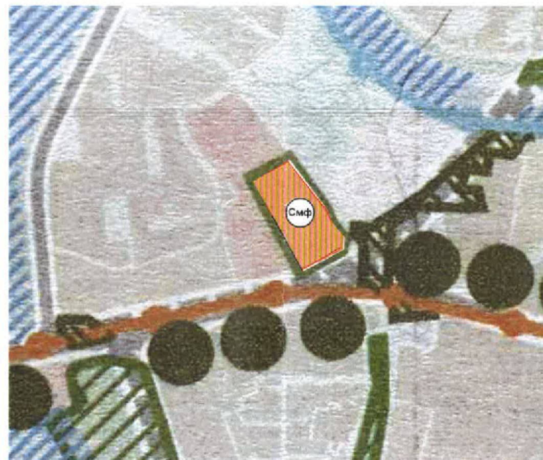
ПРОЕКТ ЗА ИЗМЕНЕНИЕ НА СХЕМАТА НА ЗЕЛЕНАТА СИСТЕМА на гр. ЯМБОЛ за имот с ИДЕНТИФИКАТОР 87374.560.61 - М 1:5000 В СЪОТВЕТСТВИЕ С ДЕЙСТВАЩИЯ ОУП