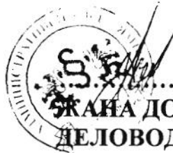
..... ЖАНА ДОБАРАДЖИЕВА ДЕЛОВОДИТЕЛ