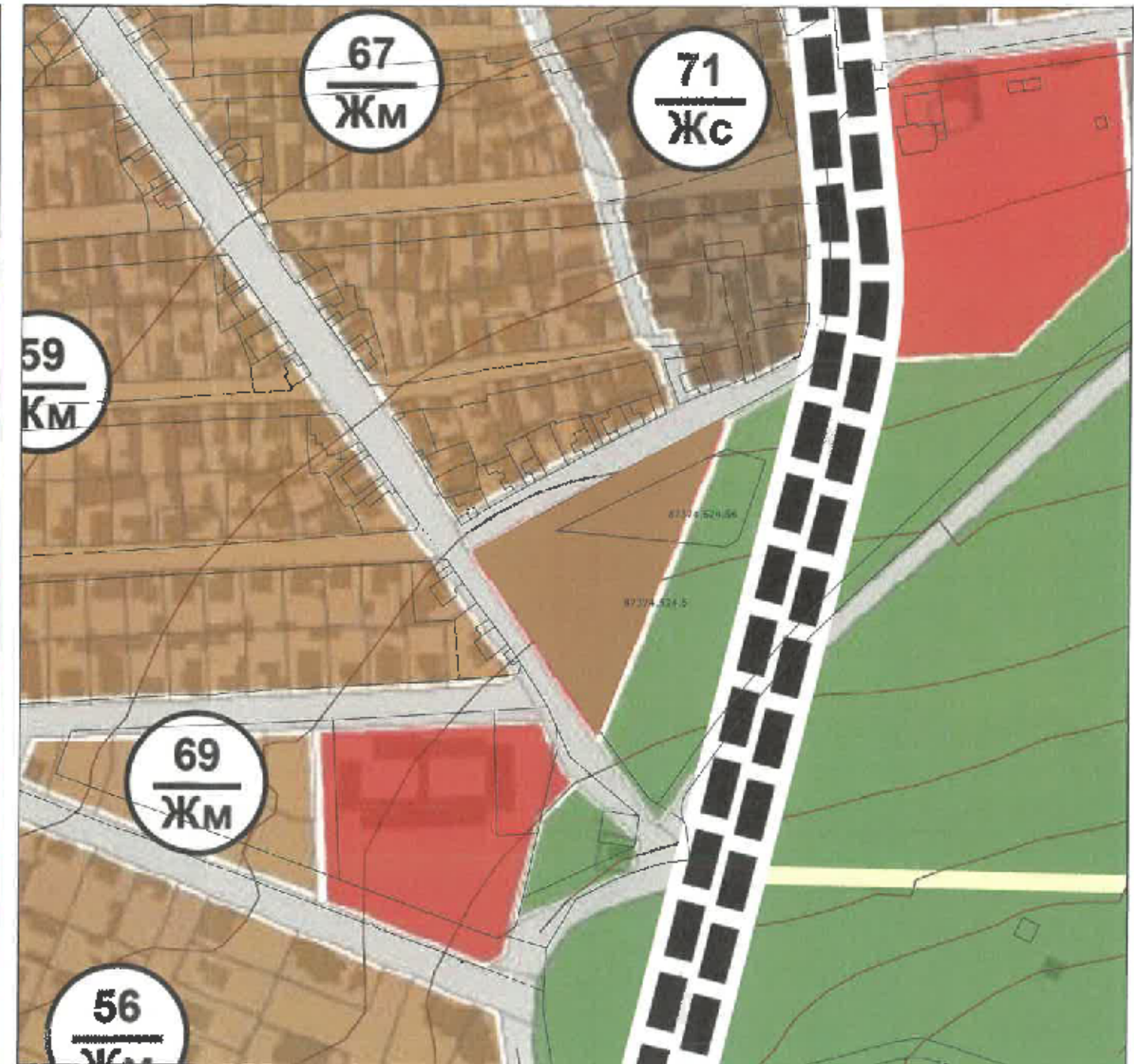
ИЗМЕНЕНИЕ НА ОБЩ УСТРОЙСТВЕН ПЛАН